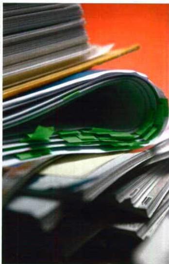
Leí pouco clara sobre o auxílio que podem dar as entidades privadas na fiscalização

E a solução que aponta para que se cumpra a legislação era de haver maior abertura às entidades externas que actuam neste mercado para fazerem esse trabalho?