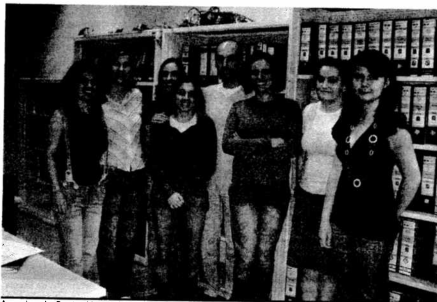
A equipa do Centro Novas Oportunidades do ISQ

A grande novidade hoje para a formação profissional é o lançamento do Catálogo Nacional de Qualificações, um instrumento evolutivo que vai sendo sempre actualizado com a colaboração dos agentes da formação profissional ligados, de alguma forma, às profissões e estima-se que vai ser um instrumento efectivamente posto em prática, ao contrário do que tem acontecido