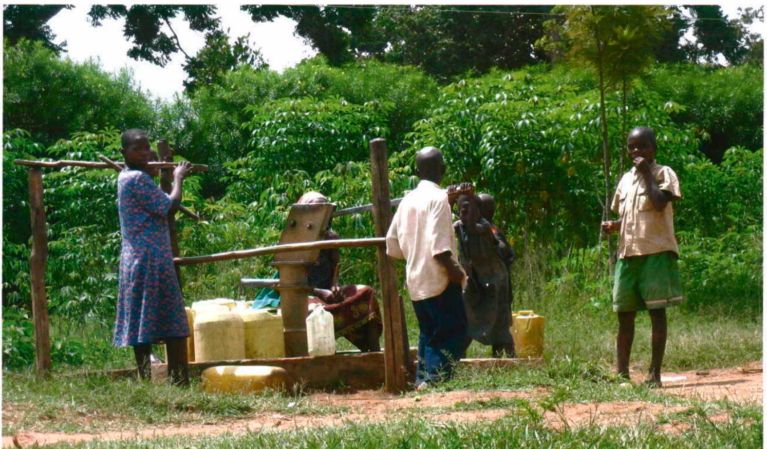
Em África a oferta não consegue responder à procura; por isso, algumas das cidades mais caras do mundo encontram-se neste território

A aposta das empresas portuguesas no mercado africano passa sobretudo pelos PALOP e pelo Magrebe. O ISQ tem trabalhado com todos os PALOP, desde há vários anos, e, mais recentemente, com todos os países do Magrebe, sendo que Angola e Argélia constituem os seus principais mercados. Nestes países, o ISQ realiza trabalhos em estudos e no apoio técnico em diversos descritores ambientais, desde a água, o solo, o ar, o ruído, bem como